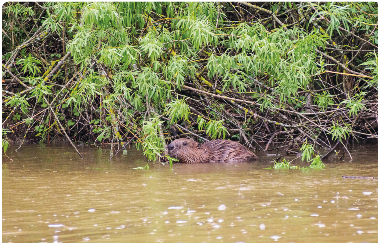
Samstag, 2. Juni 2018 18.00 Uhr Treffpunkt: Alte Fähre Lochau

Veranstalter: Energieregion Leiblachtal, e5 Team Hörbranz